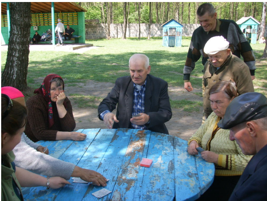
Og så spilles der 'fjols' i haven mellem beboerne.