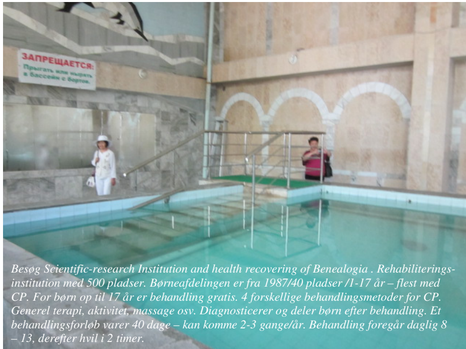
Besøg Scientific-research Institution and health recovering of Beneologia. Rehabiliteringsinstitution med 500 pladser. Børneafdelingen er fra 1987/40 pladser /1-17 år – flest med CP. For børn op til 17 år er behandling gratis. 4 forskellige behandlingsmetoder for CP. Generel terapi, aktivitet, massage osv. Diagnosticerer og deler børn efter behandling. Et behandlingsforløb varer 40 dage – kan komme 2-3 gange/år. Behandling foregår daglig 8 – 13, derefter hvil i 2 timer.

Ingen af grupperne nævnte andre årsager. Det blev nævnt, at Regeringen har iværksat en TV-kampagne om bevidsthed om handicap.