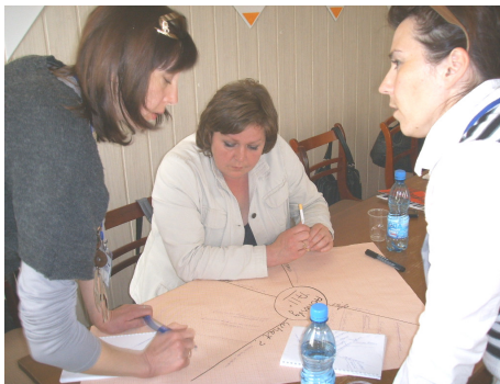
Seancer fra udvikling af barriere fri skoler i Kobrin. Et cross sektor samarbejde mellem lokale borgere og social centeret