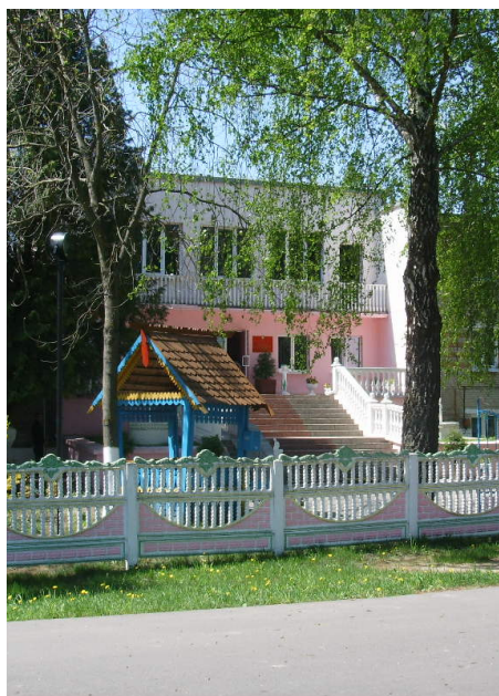
Kobrin specialinstitution set udefra

De ansatte er passere uden egentlig medicinsk eller pædagogisk uddannelse, da løn og vilkår ingen status har. Der var dog gode positive tiltag i gang. Som landets første institution var to ældre borgere, et ægtepar, flyttet til egen bolig. Denne hændelse blev promoveret til de øvrige af landets 73 lignende institutioner i landet. Det er muligt med nuværende lov at foretage udflytning til egen bolig. Men der er ikke noget system eller strategi ift. denne øvelse.