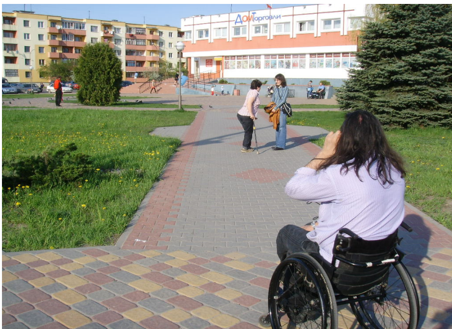
Vi gennemtravede Kobrin for at se på tilgængelighedsmulighederne

På tværs af sektorer og interesser blev der udviklet 3 lokale projekter, alle om bedre tilgængelighed for fysisk handicappede. Men tilgængelighed er jo meget mere. Vor partnere arbejder meget bredere med begrebet tilgængelighed, det drejer sig jo også om bolig, uddannelse, kultur og arbejde.