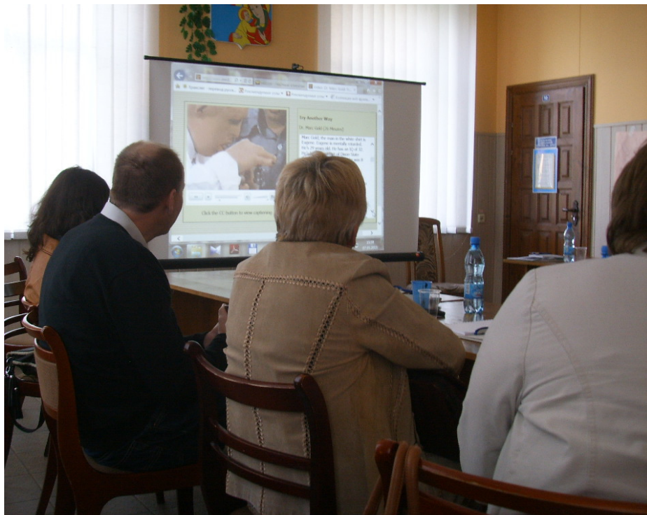
Filmen 'Try another way' gav eftertanke på workshoppen

Der var flere mål for vort besøg til Kobrin, ud over at etablere god kontakt til myndighederne og lokale borgere, skulle vi finde 3 personer, som på forskellig vis bliver vore direkte aktivitetspartnere til lokalområdet og dets muligheder for at blive en modelby for forskellige praktiske og relevante inklusionstiltag.