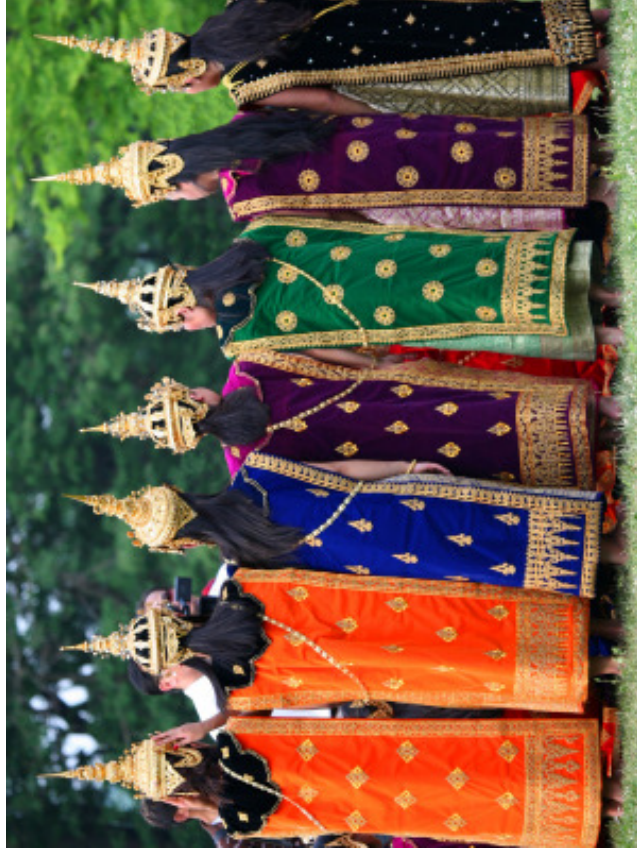
Traditionelle laotiske dansere gør sig klar