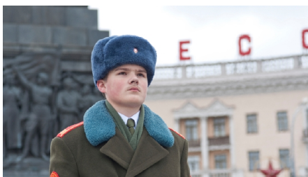
Fotoet illustrerer måske bedre end mange ord det samfund, projektet arbejder i

2 fra ledelsesniveau og personale i Kobrin Social servicecenter, 10 repræsentanter for ngo'er, der arbejder med handicappede og repræsentanter for institutioner, der beskæftiger sig med rehabilitering af handi-