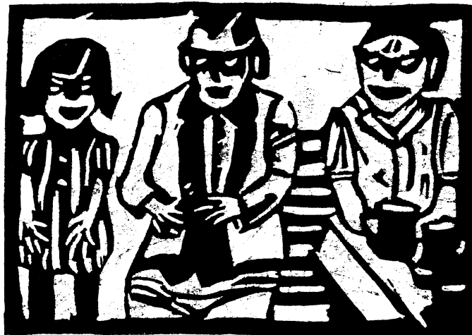
4. Til samtale med forstanderparret på Spanager, 1947