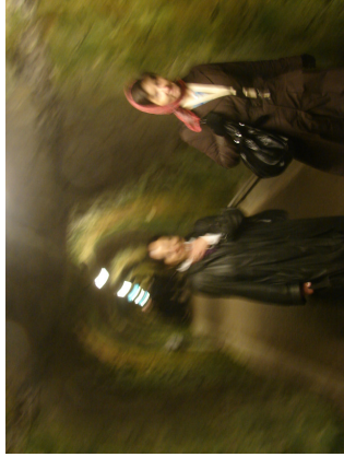
Besøg i de underjordiske gange i Koldkrigs-museet på Stevns

Et par timer med krudt, kanoner og lange underjordiske gange – og en smuk strand med the White Cliffs of Stevns –