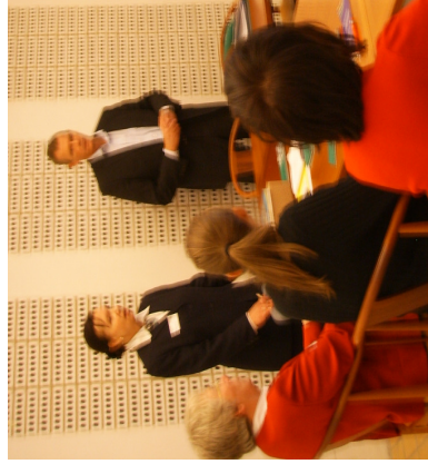
Formanden for Folketingets Socialudvalg fortæller om det danske velfærdssystem

Det var lykkedes at få sammen-sat et program, hvor vore gæster både besøgte Beredskabsstyrelsen, Falck Healthcare, Københavns Universitets Disasters Management Master Programme , Indenrigs- og Socialministeriet.