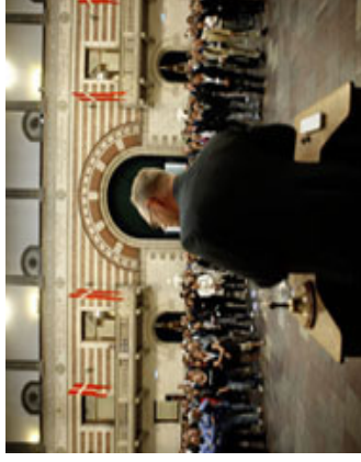
Reception på Københavns Rådhus

De 6 russiske gæster fulgte kongressens program i fire dage og fik her også lejlighed til at besøge sansesfivalen i København (på trods af regn), mens hele den russiske gruppe var med til receptionen på Københavns Rådhus og kongressens fest på Christiania.