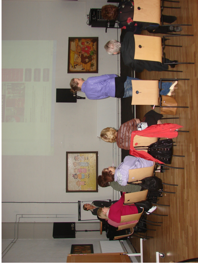
Besøg i kulturhuset 'Garaget' i Malmö

Noget som svenskerne satte pris på at se – og de ville gerne fortsætte i kontakten.