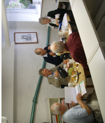
Formanden aflægger beretning

Det Europæiske Hus gennemførte i april en fremtidsikkert generalforsamling på baggrund af positive resultater i 2008.