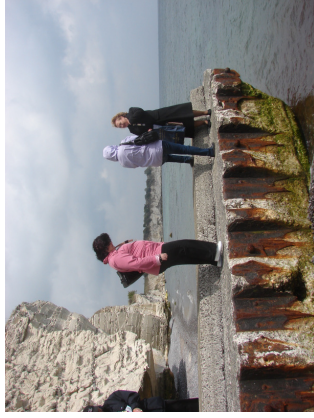
Gruppen trækker frisk luft uden for de mørke og fugtige underjordiske gange

blev fulgt op af en lille, let frokost i Kulturhuset 'Harmonien' i Rødvig.