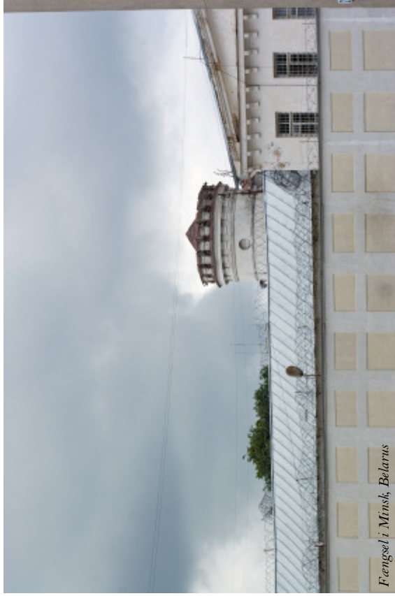
Fængsel i Minsk, Belarus

en tredje sektor med NGO'ere og folkeoplysning. Det indebærer, at den mangfoldighed af foreninger som vi i Danmark anser for en naturlig del af vores hverdags, ikke