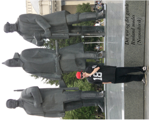
Det nye og det gamle Rusland mødes (Novosibirsk)