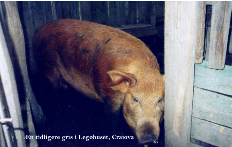
En tidligere gris i Legohuset, Craiova