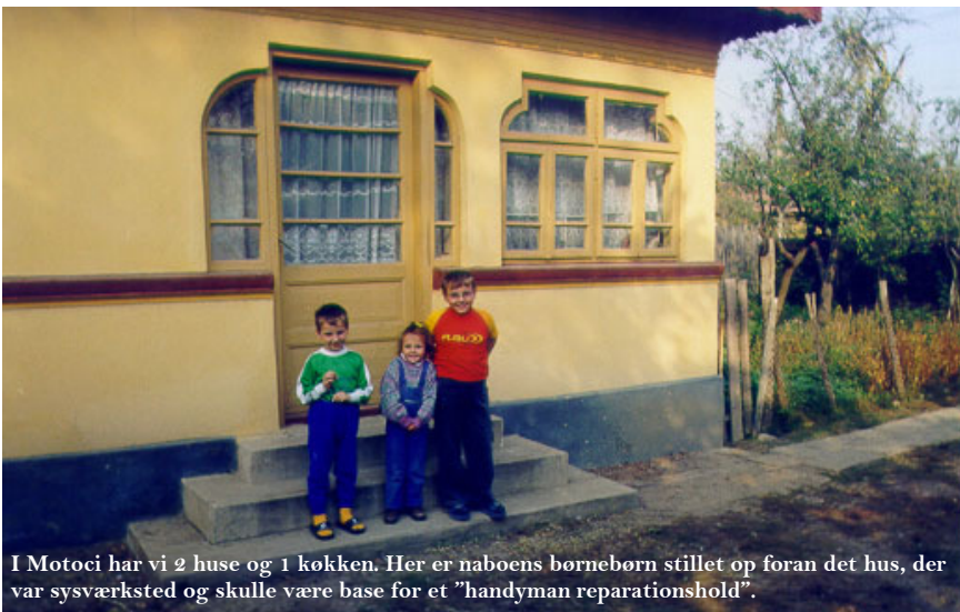
I Motoci har vi 2 huse og 1 køkken. Her er naboens børnebørn stillet op foran det hus, der var syværksted og skulle være base for et "handyman reparationshold".

Vi håber, EU-medlemskabet kan være med til at give en slags 2. interessebølge som den, vi så først i 1990'erne i de europæiske lande, også i Danmark.