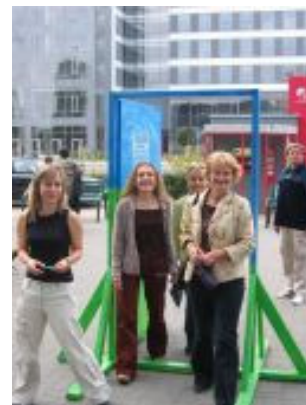
Til konference i Warszawa

Du kan læse mere på hjemmesiden http://www.progress-equal.eu/index.php?url=home&click=1 Den er på polsk