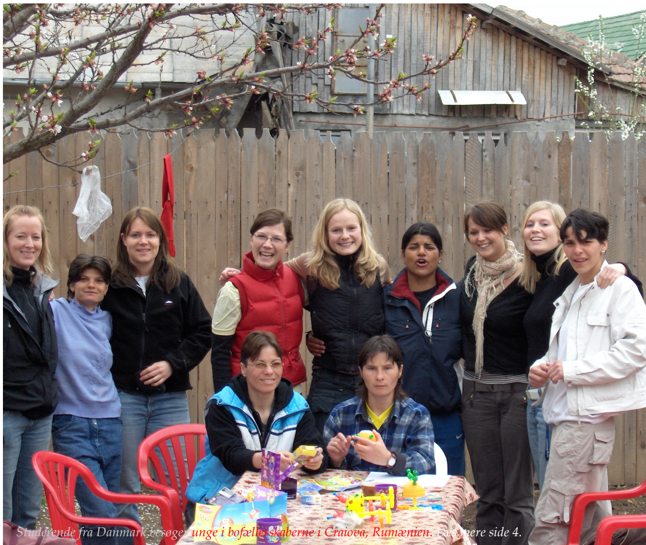
Studerende fra Danmark besøgte unge i bofællesskaberne i Craiova, Rumænien. Læs mere side 4.