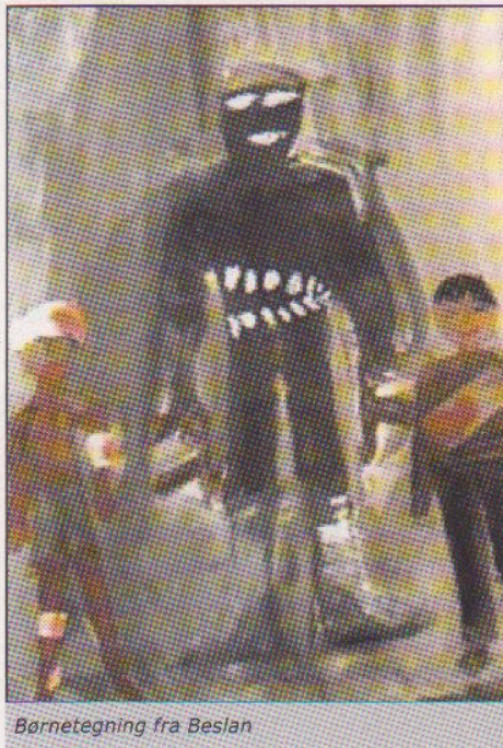
Børnetegning fra Beslan

fra andre børn i deres egen alder og andre specielt til Nytår, hvor folk er glade, hvis de ikke er ensomme. Kærlighed, opmærksomhed