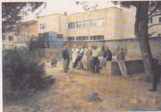
Arkivfoto: Gården i 96

DET VAR SOM OM JEG HAVDE FORLADT DET IGÅR