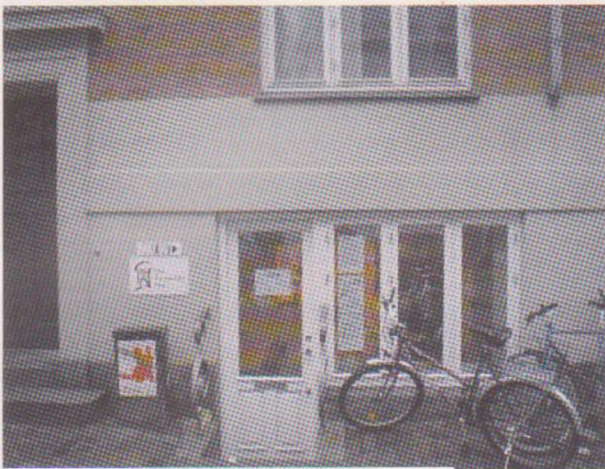
Way Outs lokaler i Helgolandsgade