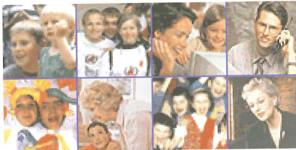
Belarus i officielle billeder (fra FN's hjemmeside)