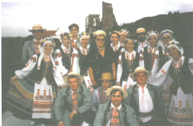
Folkedragter fra Belarus - og det er ikke Susanne i midten!

Hun er mor til 8 børn og viser mig hendes kæmpe ar ( hjerteoperation der ikke er lykkes,) jeg kunne ikke finde ud af om de havde penge til endnu en, men jeg fik deres adresse. ... jeg tænkte der kunne være andre end mig der ønskede, at gøre en forskel, så de 8 børn kan beholde deres mor !!! om ikke andet så kunne jeg sørge for at børnene fik noget tøj, sko og legetøj., madkonserver.