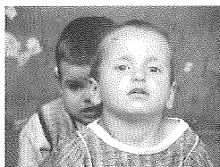
Følg med i arbejdet på www.europeanhouse.org

Anse Leroy fortalte om arbejde med klubhusene i Albanien, Rumænien og Kosovo, Makedonien. Klubhusene i Kosovo og Makedonien er etableret i samarbejde med WHO, der er meget aktive i dette område.