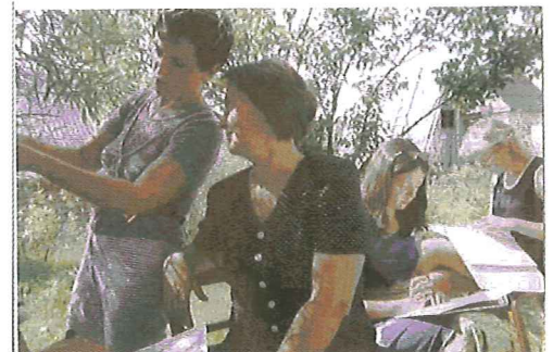
Krisecentret i Minsk arbejder støt videre...