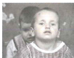
Følg med i arbejdet på www.europeanhouse.org