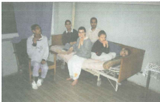
Foto: Unge handicappede på Camin Spital i Craiova - der er fortsat meget at gøre i f.eks. Rumænien

Særligt fokus i beretningen i år er arbejdet i Belarus og med etablering af krise-centre.