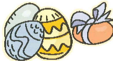
Det Europæiske Hus er godt at få æg med - for umage giver mæge

Når foreningen derfor går i gang med disse aktiviteter i Danmark, er det altså ikke så forskelligt fra at arbejde med projekterne i central- og østeuropa. Det handler om at påvirke på alle niveauer: det individuelle, det nære og det samfundsmæssige.