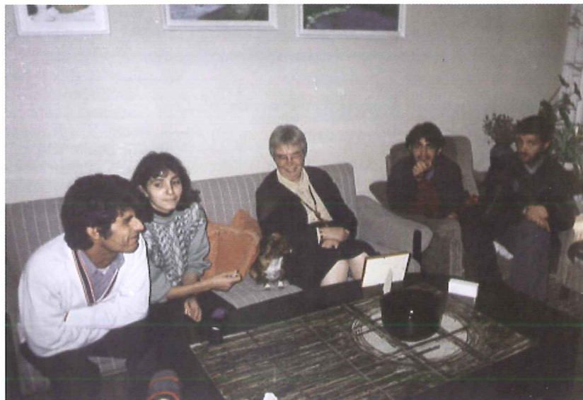
Foto: Lise From, DEH's kasserer, på besøg i et af bofællesskaberne i Craiova. Her drøftes bl.a. de unges deltagelse i beslutninger og økonomi. Noget nyt i Rumænien.