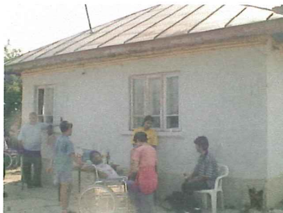
Lego-huset i Craiova, hvor DEH er ved at opbygge et værkstedscenter, der skal oplære de unge og bygge bro til det almindelige arbejdsmarked.

På verdensplan støtter Zonta International en lang række projekter, der skal være med til at fremme kvinders status. Det sker både gennem FN og direkte til projekter inden for uddannelse og udvikling. Derfor er DEH lidt stolte over, at Zonta Næst-