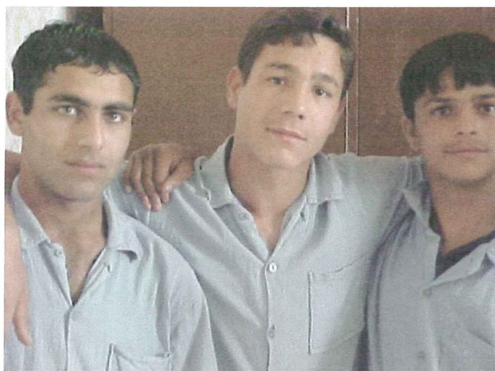
Overalt i Europa diskrimineres Roma befolkningerne. Billedet er fra ungdomsfængslet i Bulgarien, hvor der er en klar overrepræsentation af unge Roma – fordi de kommer fra de mest kummerlige forhold. DEH arbejder for at forbedre de fattige Romaers muligheder.

Pengene er taget fra det honorar, DEH får for at deltage med konsulentbistand i projektet.